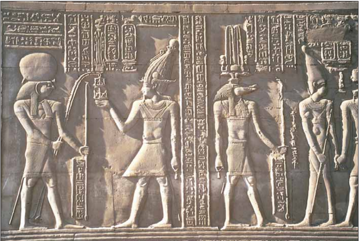
Wandrelief im Tempel Kom Ombo