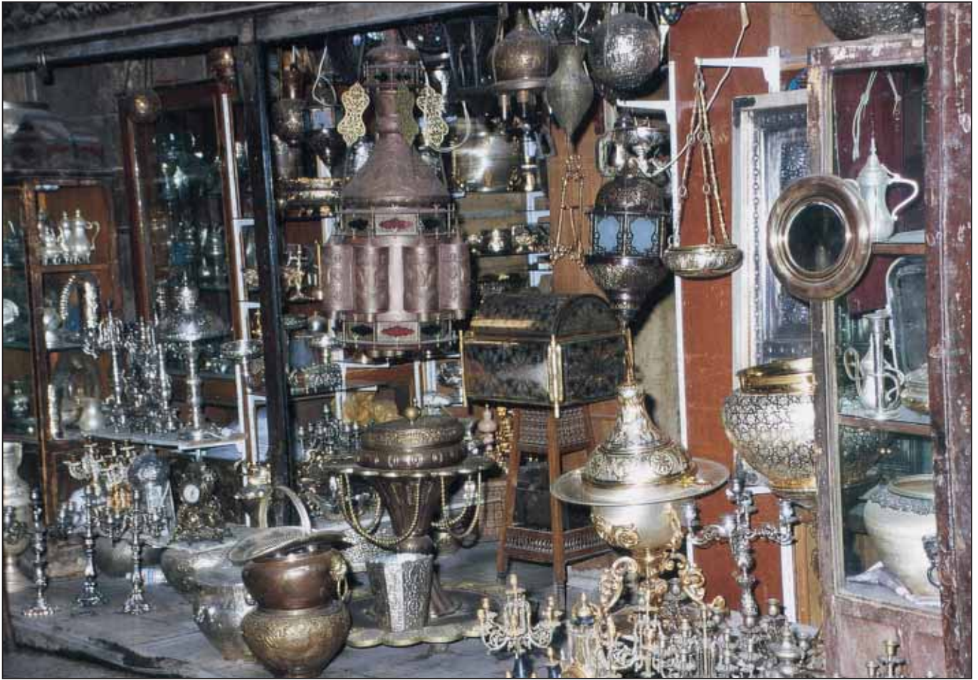
Altstadt Kairo, Kha El khalili